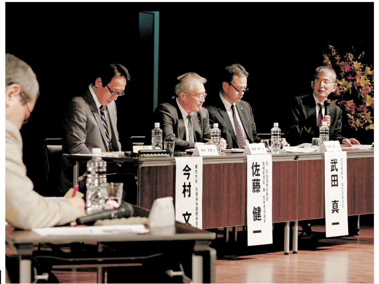
防災・減災の在り方をめぐり活発に意見を交わしたシンポジウム =22日、仙台市青葉区の東北大川内萩ホール

第1部パネリスト 東北大災害科学国際研究所 所長 元気仙沼市危機管理監 東大総合防災情報研究センター 長 河北新報社論説副委員長 進行役 (第2部も) 東大名誉教授